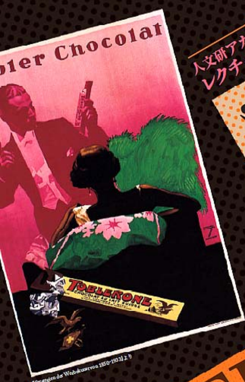
「Strategien der Werbung» (von 1850-1933)より