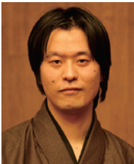
片岡一郎 (かたおか・いちろう)

1959年、大阪府吹田市生まれ。現在、京都大学人文科学研究所教授。京都や奈良の地域から京都の近代を考えるのが最近の研究の主題。著書に、『陵墓と文化財の近代』（山川出版社、2010年）、『近代天皇制と古都』（岩波書店、2006年）、『近代天皇制の文化史的研究—天皇就任儀礼・年中行事・文化財』（校倉書房、1997年）などがある。