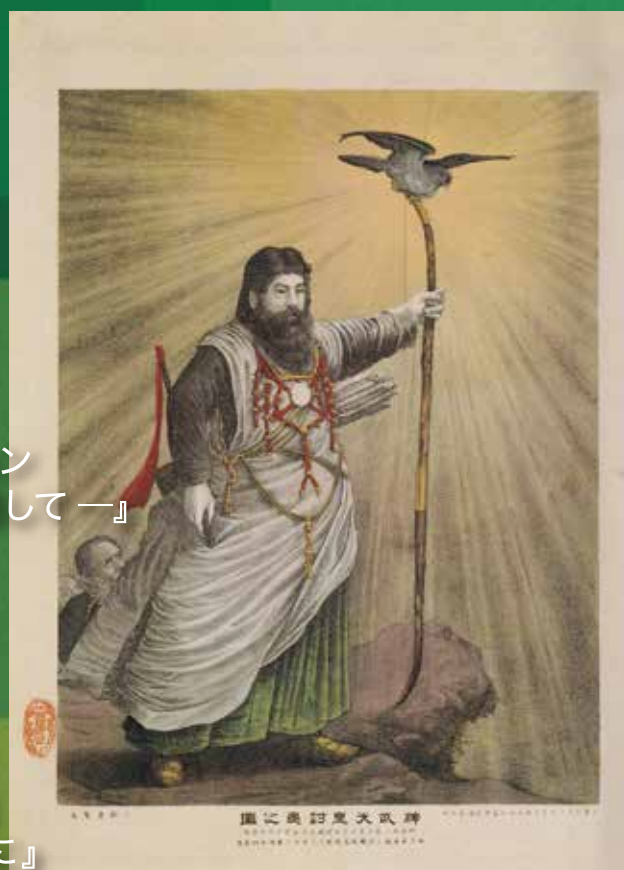
梶原神宮史・別巻より